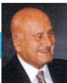
C.C.C. Chairman of the Board

It is truly my pleasure to welcome everyone at our annual “Greek Islands” Bridge Festival, which we sponsor in the beautiful island Rhodes. It is my wish that bridge players from around the world will find the games challenging and their summer holidays memorable.