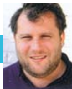
World Bridge Champion

It is with great joy that I realize that the “Greek Islands - Bridge Festival” is becoming a great tradition. I believe that this year, we will have once more the opportunity to combine great holidays while enjoying a great bridge tournament.