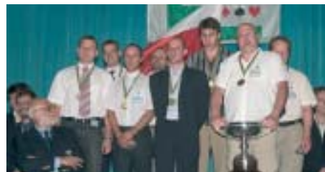
Η πρωταθλήτρια Ευρώπης Νέων 2005, ομάδα της Πολωνίας

Τέλος, στο πρωτάθλημα Κοριτσιών, όπου μετείχαν οι ομάδες 10 χωρών, η Σουηδία διατήρησε και αυτή την περσινή 2η θέση αθλή η Αυστρία έπεσε 3η, από 1η που ήταν το 2004.