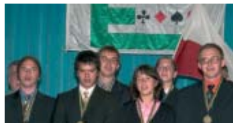
Η πρωταθλήτρια Ευρώπης Μαθητών, ομάδα της Πολωνίας