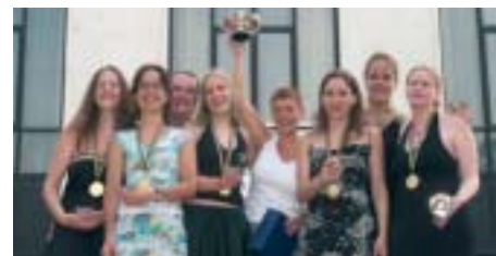
Δροσιά και χαμόγελα. Η πρωταθλήτρια ομάδα κοριτσιών της Ολλανδίας